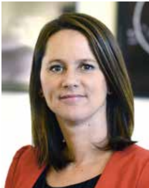
Johanna Rolland, Maire de Nantes

La sécurité est un droit pour toutes et tous et un enjeu essentiel de cohésion sociale pour notre ville. À Nantes, nous nous mobilisons